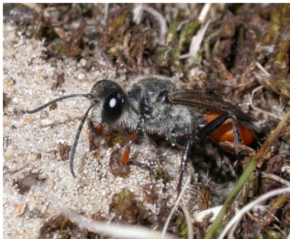
Figure 1. Femelle de Sphex funerarius à l'entrée de son nid

En Allemagne, alors que sa présence n'était plus établie depuis le début des années '60, il a été trouvé dans le sud du Baden-Wurtemberg dès le milieu des années '90 où il est bien implanté dans les dunes intérieures (Schmid-Egger, 1996; Freundt, 2002). En 2001, il a été découvert bien plus au nord, à Wesel en Rhénanie du Nord-Westphalie, également dans un biotope sablonneux et chaud (Freundt, 2002). L'espèce y est prédatrice de l'orthoptère Phaneroptera falcata . On le trouve aussi dans la Hesse en 2000 (Dressler, 2000), en Rhénanie-Palatinat en 2003 (Reder, 2003). Sphex funerarius semble être en expansion en Allemagne et utiliserait, à l'instar de Sceliphron curvatum , la vallée du Rhin comme voie de progression vers le nord-ouest (Schmid-Egger, 2005). Cette expansion est confirmée par Stolle et al. (2004) qui le citent du land de Saxe-Anhalt alors qu'il n'y avait plus été observé depuis 1960.